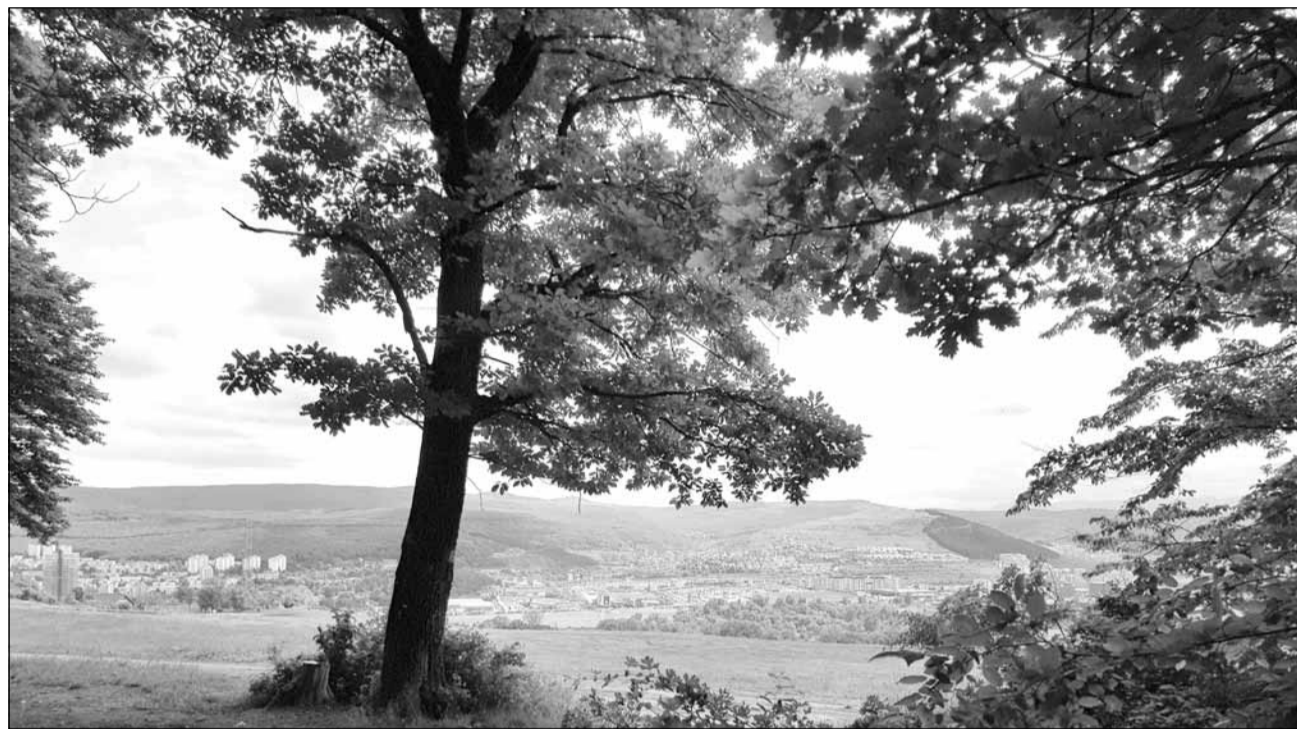
O cercetare realizată în SUA arată o relație directă între rata incidenței cazurilor de coronavirus și lipsa accesului populației la spații verzi

■ Întărește sistemul imunitar. Plimbările frecvente în natură cresc activitatea celulelor NK (Natural Killer cells) care la rândul lor joacă rol important în îndepărtarea celulelor atacate de virus. Celulele NK sunt activate de fitoncide, substanțe