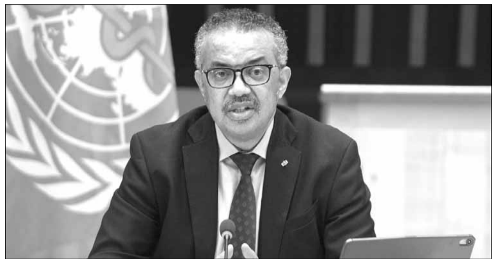
TEDROS ADHANOM GHEBREYESUS | șeful OMS

La rândul său, Agenția Europeană a Medicamentului