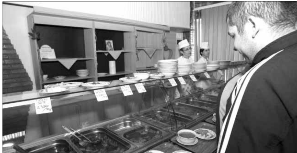
Studentii de la UTCN pot mânca gratis la cantină dacă sunt vaccinați

„Revenim cu detalii legate de gratuitățile pe care universitatea le oferă pentru studenții vaccinați. Este vorba de mese gratuite în valoare de 12 lei la cantinele UTCN pe toată perioada lunii noiembrie. Gratuitatea se adresează tuturor studenților UTCN care până în data de 20 octombrie pot face dovada vaccinării prin deținerea unui greenpass cu schemă completă de vaccinare (ambele doze de vaccin și 10 zile trecute de la ultima doză)”, au transmis reprezentanții Organizației Studenților din Universitatea Tehnică Cluj-Napoca (OSUT).