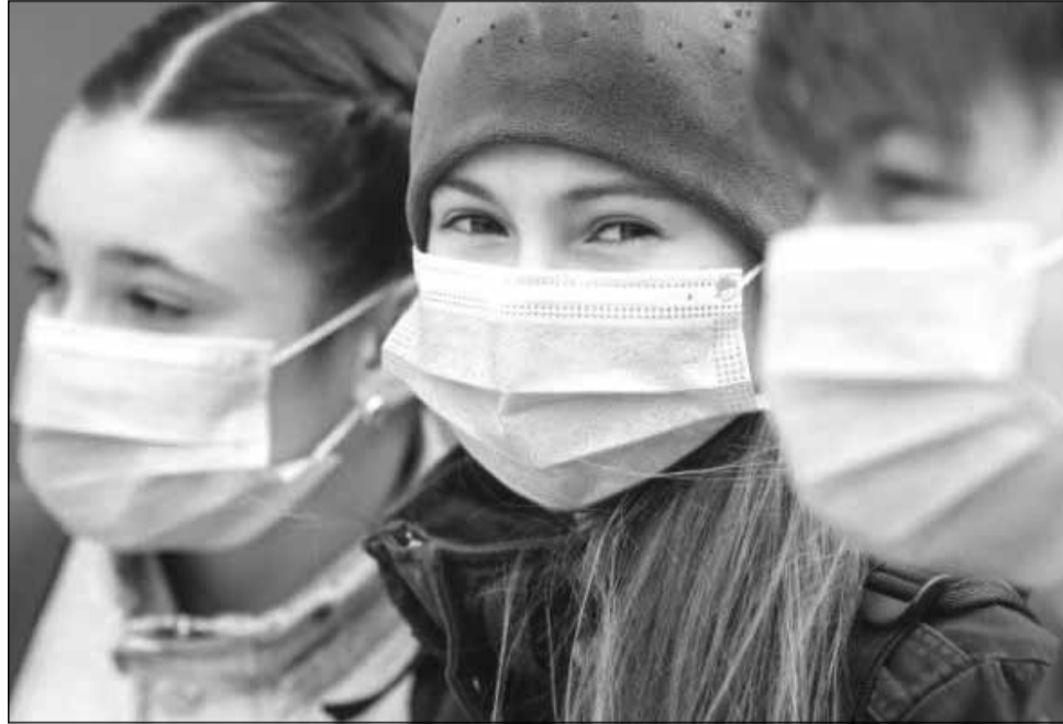
Cinci școli din Cluj, închise din cauza valului 4 al pandemiei de coronavirus

De asemenea, 91 de școli din județ își susțin cursurile în format fizic, având cel puțin o clasă/grupă în sistem online, în urma apariției cazurilor de infectare cu COVID-19.