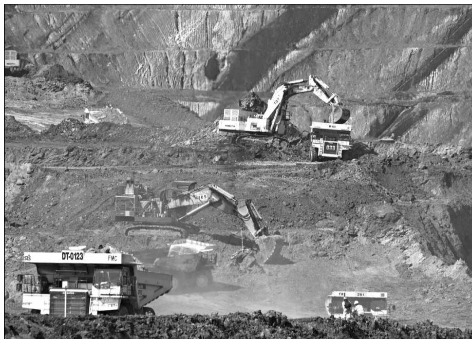
Scumpirea gazelor naturale obligă companiile europene să treacă pe cărbune

În ultimii doi ani costurile pentru termocentralele pe gaze naturale au fost mai mici decât pentru termocentralele pe cărbune, dacă sunt incluse și costurile cu certificatele